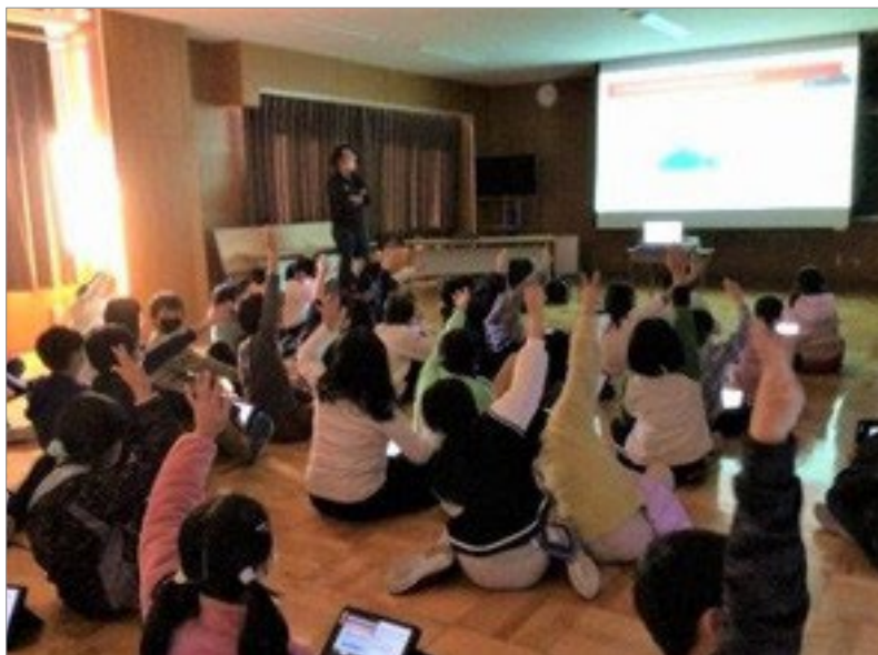
高等学校の企業訪問(上)と小学校とオンラインでの出前授業(下)の様子。