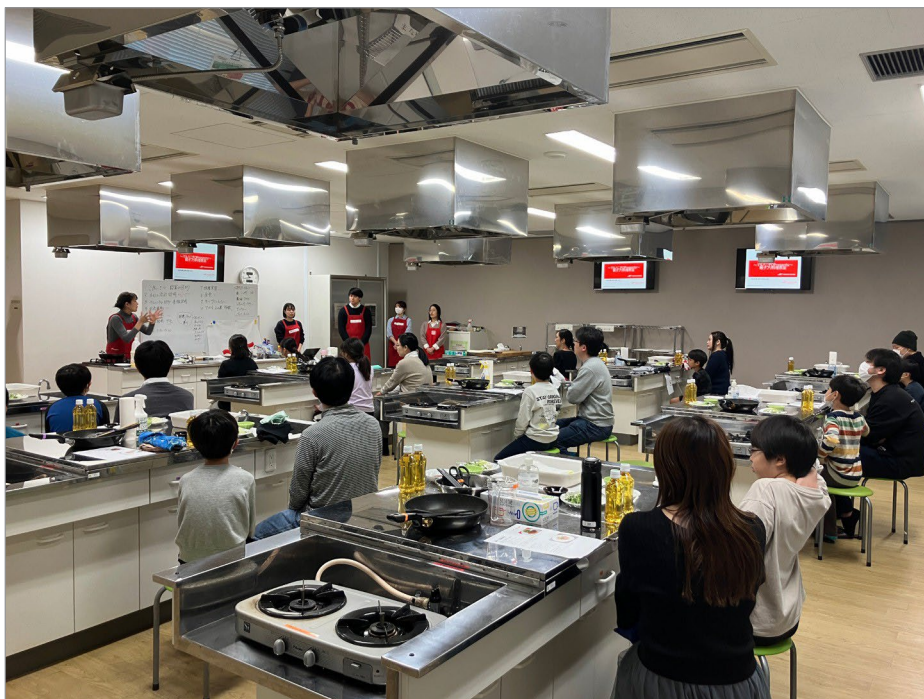
Umiosが養殖した、ASC認証を取得したブリを使った親子料理教室。

2025年2月には、弊社が大分県の上浦漁場で養殖しているASC認証（*1）を取得したブリを使った料理教室も実施しました。ASC認証、MSC認証（*2）といった水産エコラベルに関しては、まだまだ知名度が低いのが正直なところですので、調理を行う前にASC認証、MSC認証の説明を加えるなどの工夫を行い、認知を高める取組も行っています。