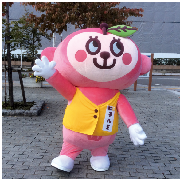
青森県消費生活センターマスコットキャラクター 「テルミちゃん」

当センターのマスコットキャラクター「テルミちゃん」は、平成21年度に誕生したキャラクターです。最初はイラストだけだったところ、平成28年度には着ぐるみを作成し、さらにはテルミちゃんダンスも作りました。消費者トラブルに巻き込まれたり、疑問を感じたりすることがあれば消費生活センターに電話して「TEL+Me=私に電話して」ということで、“テルミ”ちゃんになりました。