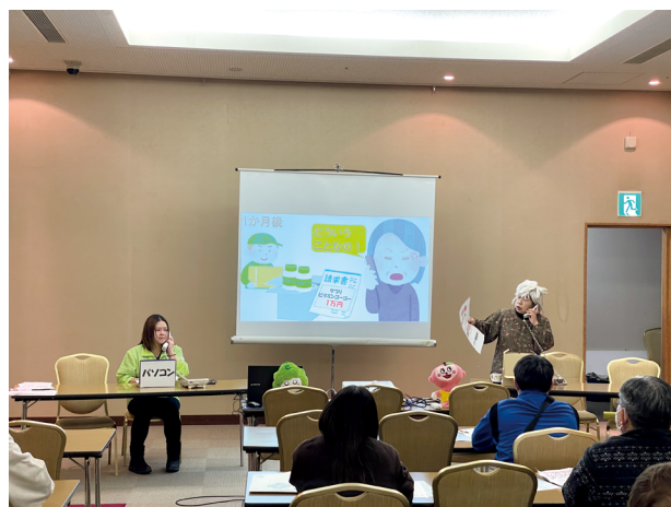
「移動消費生活講座」の一コマ。スライド資料も併用しながら臨場感のある寸劇で啓発